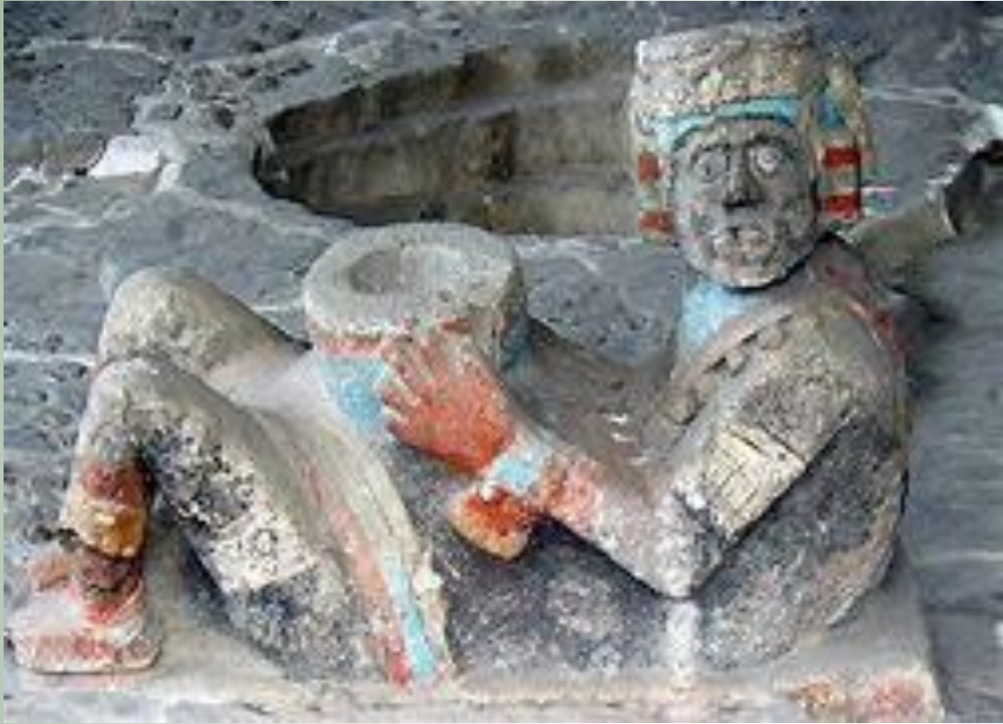
CHAC MOOL ENCONTRADO EN EL TEMPLO MAYOR, CENTRO HISTÓRICO