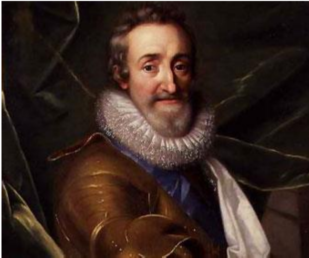
Enrique IV rey de Navarra y Francia