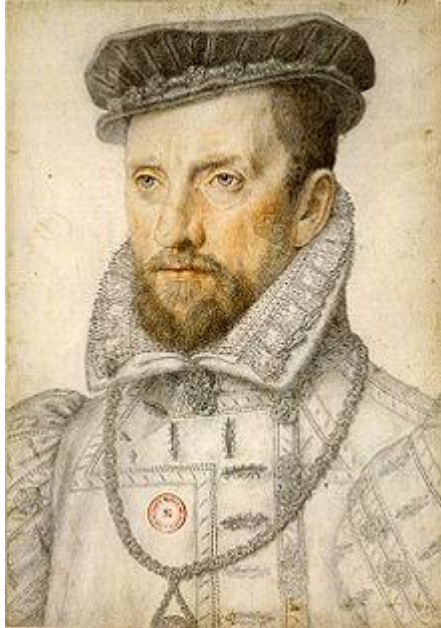
Gaspar de Coligny noble francés, político y militar

Tras un período de revueltas y tensiones entre ambos grupos, Carlos IX, aconsejado por su madre Catalina de Médicis, concertó con los hugonotes la paz de Saint-Germain, el 8 de agosto del año 1570, por la que se respetaba el culto protestante dentro del reino. A su vez, el líder de los protestantes, Gaspar de Coligny, hizo su entrada triunfal en París, favorablemente acogido por el ánimo del rey. Coligny convenció a Carlos IX para formar una alianza con Inglaterra e intervenir a favor de los Países Bajos protestantes en su lucha contra el dominio del monarca español, Felipe II, monarca que lideraba el culto católico europeo.