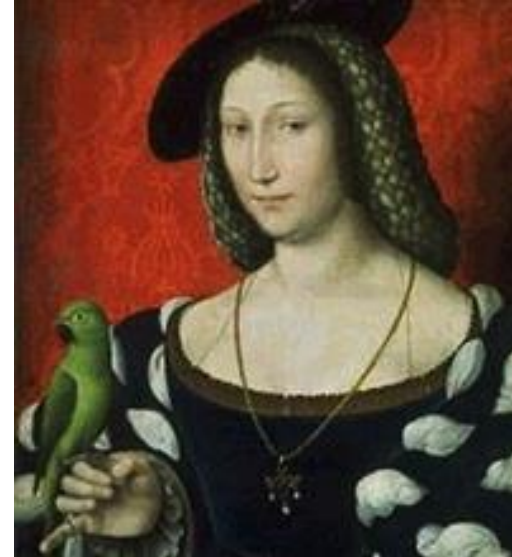
La Reina Margot, reina de Francia

Para salvar la vida, Enrique tuvo que convertirse oficialmente al catolicismo; pero en 1576 consiguió escapar de la corte y, declarando de nuevo su profesión de fe calvinista, se puso al frente del ejército protestante.