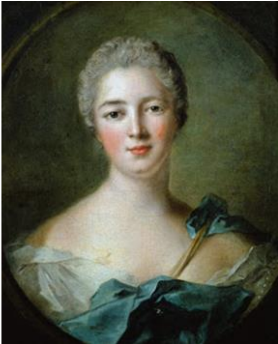
Duquesa de Etampes

Querida de Francisco I de Francia, duquesa de Étampes, nacida en 1508 y muerta en 1576. conocida como de la señorita de Heilly, era camarera de Luisa de Saboya, madre de Francisco; tenía dieciocho años cuando este príncipe se apasionó por ella. La casó con Juan de Brosse y le dio el condado de Étampes, que erigió para ella en ducado. Gobernó a Francisco I durante veintidós años; trastornó la corte y sembró la discusión en la familia real por su odio a Diana de Poitiers, querida del delfín; haciendo traición al rey, reveló secretos de Estado, favoreciendo la causa de Carlos V y de Enrique VIII. Con la intención de abatir al delfín Enrique II. Después de la muerte del rey se retiró a sus tierras y acabó su vida en retiro. Había abrazado en su retiro la religión reformada.