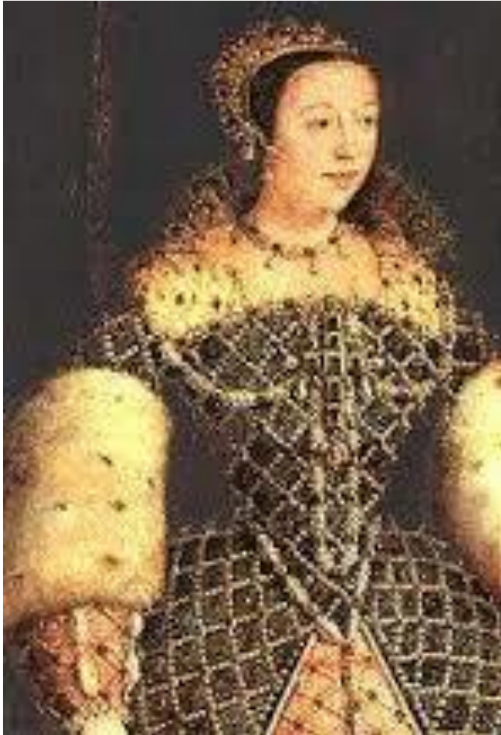
Catalina de Médicis 9.min

http://www.youtube.com/watch?feature=player_detailpage&v=tMTdb7-hdSg