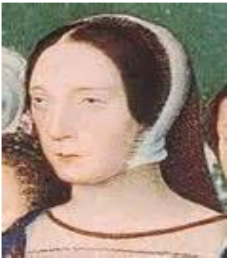
Deceso de la Reina Claudia 1524

En julio de 1530 se celebró la boda de Francisco I con Leonor de Austria, se firmó la paz con un nuevo tratado el de Cambrai, con esto se garantizaban tiempos de paz entre Francia y España.