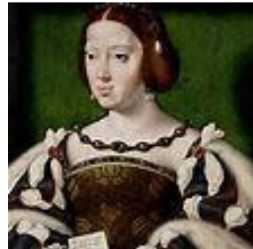
Leonora de Austria hermana del emperador Carlos V