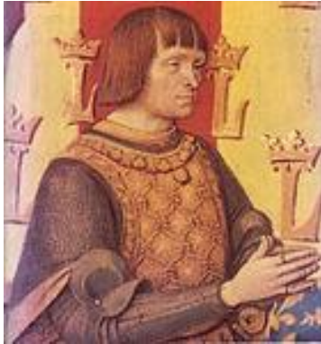
Luis XII Rey de Francia

Nacido en Blois el 27 de junio de 1462 y muerto el 1 de enero de 1515