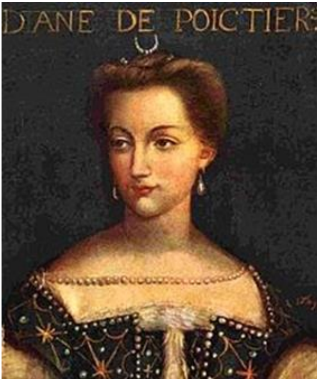
Diana de Poitiers