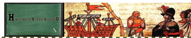
Isabel de Aragón y castilla